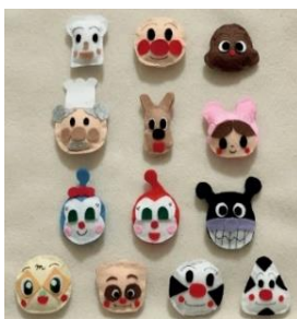
お嬢様が甥御さんにフェルト生地で作ったクリスマスプレゼントです！

⑧ 趣味で知り合った仲間は宝です。職種も環境も違うのに、音楽がすきというだけで、集えて、同じ目標に向かえる。この歳でこんな経験が出来るのは幸せだとつくづくおもいます。おっちょこちよいで、大雑把な性格です。みなさんの足を引っ張りすぎないように頑張ります。